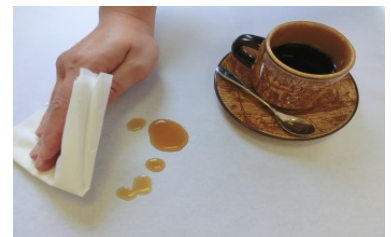
【和紙テーブルクロス 使用イメージ】

本事業で開発する和紙テーブルクロスは、手軽さ、防水・撥水性、高級感、質感、環境配慮、コストなどの点で、布製やビニール製などの類似品と比べて競争力がある。