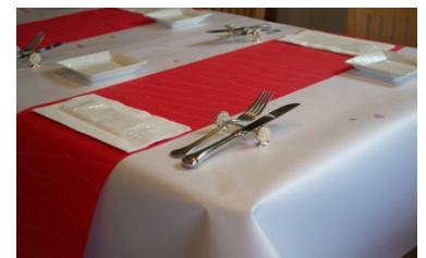
【試作品のレストランに おける使用例】