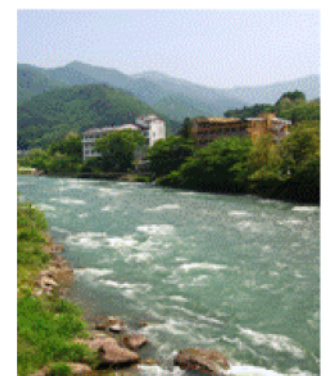
【美しい自然に囲まれた上牧温泉】