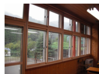
【檜原村中学校での実験設置】

マンション・学校向けの「量産タイプ」、戸建住宅向けの「個別生産タイプ」の製品を開発し、量産タイプは関東を中心とした建材メーカーへ、個別生産タイプは、50代～60代の富裕層へ向けて直販を行う。