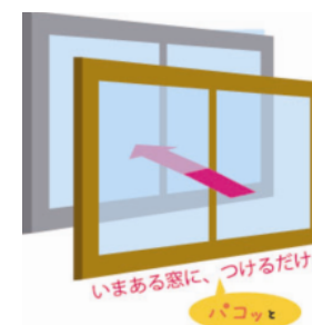
【『いいうち窓』イメージ図】

多摩産スギは、他地域のスギに比べて比重が低いいため軽くて軟らかい。これは、木材の中に多くの空隙を含むためであり、高い断熱性を持つという大きな特徴にもつながる。本事業では、この多摩産スギ材の高い断熱性を活かし、軟らかいという特性は、製造方法等を工夫することで克服し、高断熱・高气密性を確保すると同時に、デザイン性も兼ね備えた内窓を開発する。