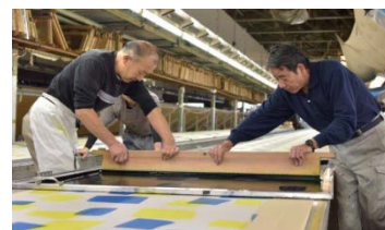
【試作品の開発の様子】

かつて女性の日常のおしゃれ着として一世風靡した、現在産地が関東にしかない地域資源の絹織物「銘仙」の伝統的技術・技法をテーマに、現在のライフスタイル・消費者ニーズに合ったコンセプトによる新商品開発、ブランド化、販路開拓などを広域的に連携して行う。本事業を通じて、「銘仙」の伝統的技術・技法の承継を図るとともに、新たなマーケットの構築に挑戦することで、絹関連産業・地域経済の活性化を図る。