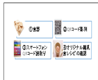
【情報提供のイメージ】