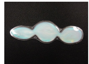
【新たに開発したウォーターインソール】

地域産業資源である靴・サンダルで長年培ってきた足フィットが良い履物の設計から製造までの技術を利用し、そこに流体力学を取り入れた新しい技術を組み込むことにより機能性を高めた靴を製造販売する。輸入商品など安価なサンダル・シューズに対抗し競争力を高めるには高い製造技術のアピールと機能に特化する事が重要であると考えます。