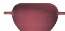
新型鍋試作品イメージ

・創業96年の中で培ってきた販売チャネル(百貨店、通販、問屋等)を活用する。また、新規ルートとしてこだわりの専門店や業務用需要のある飲食店などへの販路開拓、併せてアメリカ・欧州諸国・アジア等海外への販売などを推進することにより新事業の確立を目指す。 ・本商品は消費者に機能性等を売り込む説明・説得型商品のため、売り場にて自社販売員(全国に約20名)による実演販売などのプロモーション活動を展開する。