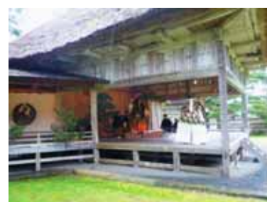
佐渡に残る能舞台