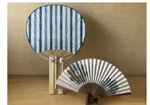
【地域産業資源:団扇・扇子】