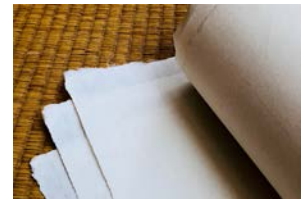
【地域産業資源:和紙(市川和紙、西嶋和紙)】

申請者を中心に、観光推進機構等の関係事業者・関係団体とともに、「富士川流域クラフトツーリズム実行委員会」を設置し、市川三郷町、富士川町、身延町、県等と連携しながら、本事業を実施し、地域を挙げてブランド化に取り組んでいく。