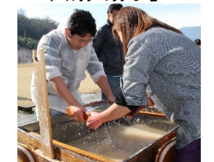
【商品イメージ:和紙アート体験】