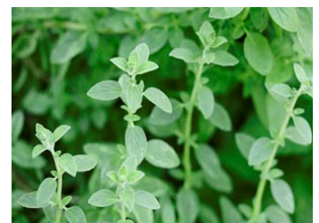
【自社栽培のオレガノ】

高品質な新鮮バターであるほか、パンに塗りやすく使いやすいスプレッドタイプである点、ハーブ類は自社生産品のためオール伊豆産を謳える等の特長がある。