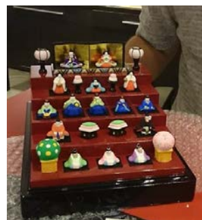
【節句人形イメージ】

手土産サイズ版岩槻人形の開発製造は、岩槻地域の産業集積内の人形製造事業者と連携しながら取り組んでいくことで、事業化を達成していく。また、さいたま商工会議所からは経営・販路開拓の支援を仰ぐ。さらに金融機関からも海外展開・輸出をしている日本企業への販路開拓支援を仰ぐ。