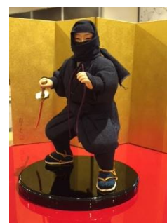
【歴史シリーズイメージ】