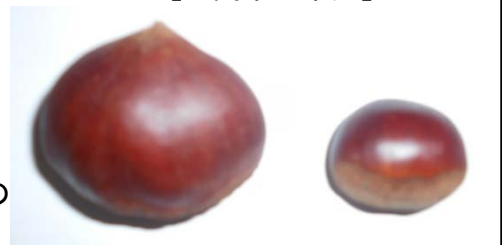
【4Lサイズの長谷川くり】【Mサイズの栗】