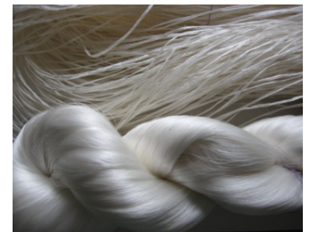
【上：極太生糸、下：極細生糸】