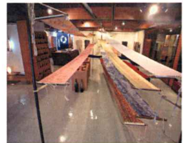
【800種類を超える型紙ストック】

・業界の流通事情に精通した専門家との協力関係を活かし、既に取り実績のある①インテリアショップ、②セレクトショップ、③ミュージアムショップ等を中心に販売基盤を築く。併せて、自社内工房を利用した染色体験教室開催やインテリア関連の見本市等への出展を通じ、有望流通業者への企業コンセプトとブランド思想の浸透を図る。