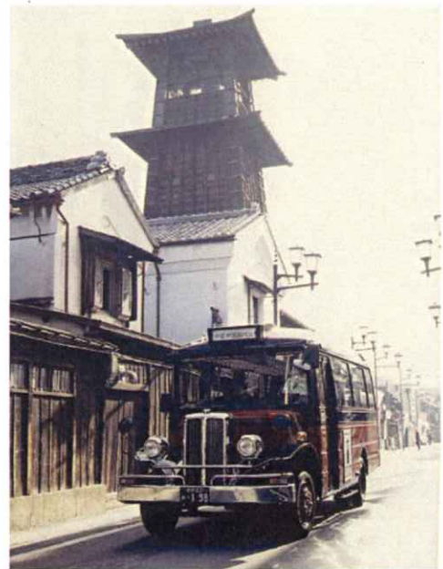
【川越の蔵造りの町並みとレトロバス】