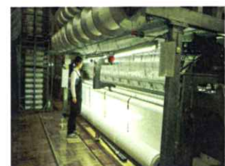
【工程を管理する社員】