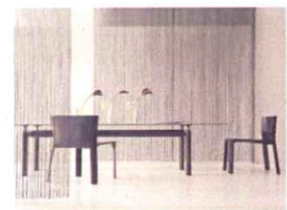
【ストリングスカーテン】