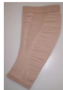
【IOCA-C21素材のサポーター】