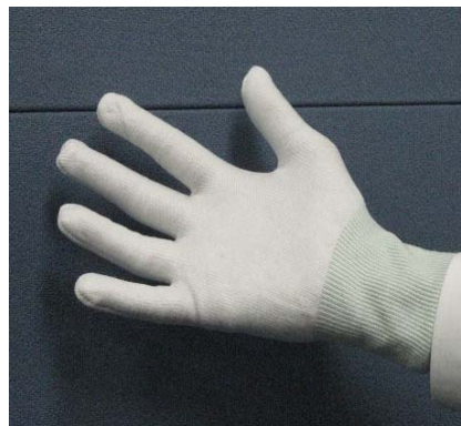
【耐刀性作業用手袋】

・高性能の付加価値商品としての作業用手袋を中心に製品及び糸の販路を拡大するため、商社の協力も得て、国内外の産業資材展示会に出展し、製品のPRを進める。