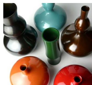
【ユーザーセレクションデザイン花器「Asiwai」】