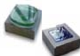
【金属棒にガラスを流し込む「ガラスキャスト」】