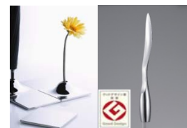
【高耐蝕性アルミに機能性を持たせた「AQUARIUM」】