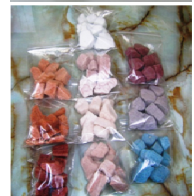
【改良スーパーソル】