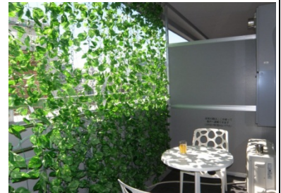
【屋外用みどりのカーテン】