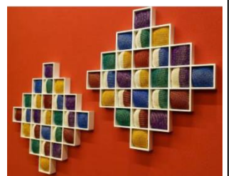
【水引の壁面インテリア】

同社の水引糸は業界最多の133色のカラーバリエーションであり、また、同社独自技術による刺繍模様等を活用して製造する本事業商品は、意匠性が高く、色彩も豊かで、空間を彩るオリジナリティの高い商品となっている。