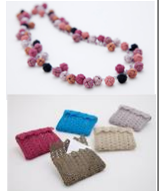
【アクセサリ・雑貨】

地域産業資源「加賀水引細工」の特徴である、軽くて、水に強く、色が豊富で、さらに造形度の自由性が高いことを活かし、同社は小物・雑貨商品の企画・製造・販売を行ってきた。本事業は、水引細工をデザイン性の高い大型の空間インテリア商品にまで価値を高めるもので、加賀水引細工の特徴である「あわじ結び」や同社独自の「刺し水引」技術による刺繍模様等を活かし、独自性の高い水引インテリア商品を製造・販売する事業である。また、域内の他の希少伝統工芸品事業者へも地域資源の新たな活用の視点を提供することで、地域経済の振興に寄与していく。