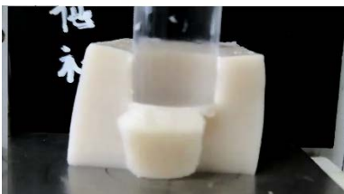
【ごまどうふ咀嚼試験: 他社製】