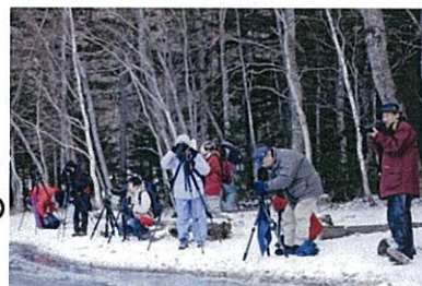
【 撮影指導ツアー 】