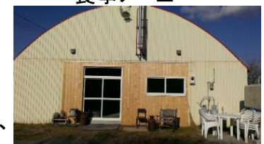
D型ハウスを改装した 宿泊施設

同地における観光は、従来景観を中心としたものである中、地域の資源を食や体験を通じ提供するの初めであり、優位性がある。