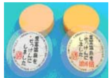
【豊富温泉せっけん】