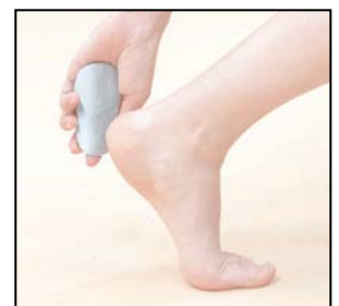
【使用するイメージ】

当初は、県内外の百貨店、雑貨店などへの販路開拓から取り組み、市場認知度を向上させた後、エステサロンやネイルサロン、介護施設、ホビー関連業者などに向けた販路開拓を目指していく。