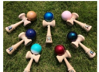
【高付加価値けん玉】

広島県廿日市市の地域資源である「木製製品」の加工技術である「ろくろ技術」「塗装技術」を活かし、「見た目が美しい」「プレイしやすい」「希少性が高い材料を用いる」などの特徴をもった、「高付加価値けん玉等の遊べるオブジェ」を開発する。廿日市市の木製製品の特徴である「ろくろ技術」や「塗装技術」を駆使して、市場に無い付加価値の高い商品を開発し、国内外の顧客に対して販路開拓を行っていく。この取り組みにより、廿日市市の木製製品のブランド向上を目指す。