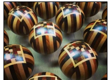
【寄木細工のオブジェけん玉】

当社が持つ「精度の高いろくろ技術」「色が美しく剥がれにくい塗装技術」を活用することで、プレイしやすく、丈夫で美しいなどの特徴をもった商品を開発する。また、希少な木材を使用する商品は類似品が少なく希少性が高い。