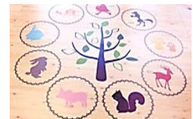
【印刷可能なPETフローリング】