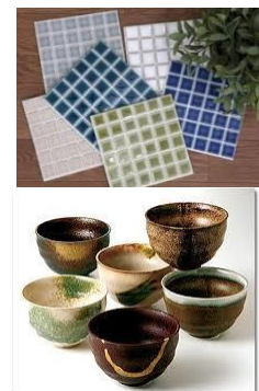
【地域産業資源 美濃焼】

岐阜県多治見市にて昭和24年に七窯社という屋号で事業を始め、タイルの卸売を皮切りに外壁用の一般的なタイルを中心に扱っていたが、海外安価品の流入や大手メーカーの寡占化により取扱量を減少させる中、小型プレス機を保有することを活用し小型タイルに特化し、一定の売り上げを確保できるようになっている。そのような中、事業の多角化による安定化や、BtoC分野への進出などを狙い非タイル製品の展開を図るようになり、その代表的な製品が本事業で展開するアクセサリー類である。