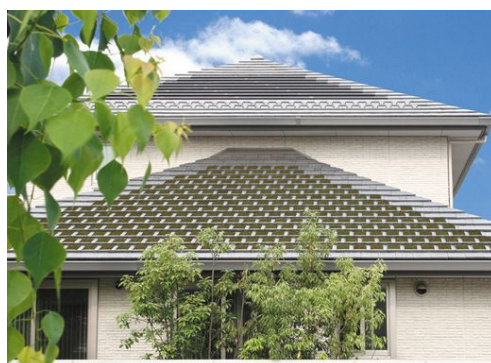
【環境瓦を使った事例】