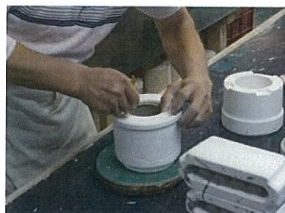
【鑄込みによる成型風景】