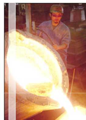
【鋳物フレーム鋳造工程】(株)古久根