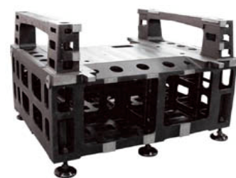
【実装機フレーム完成】 (コクネ製作(株))