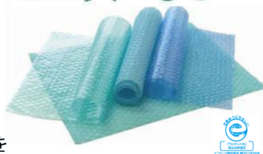
【本事業商品「エコハーモニー」】