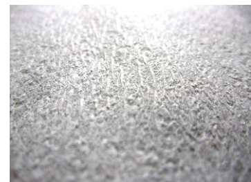
【クレープ加工を施した表面】