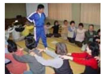
【専門家による運動講習】