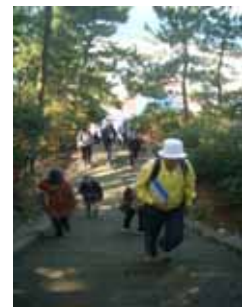
【八代神社でのウォーキング】