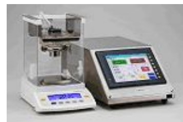
【ゼロバランサー】 超微量粉末自動計量機