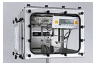
【ダストディパーチャーα】 粉塵供給、粉塵環境試験装置