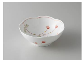
【赤絵草花 和らく45小鉢】