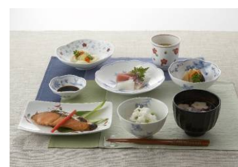
【「和らく」アソート例】