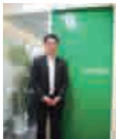
コーポレートカラーの緑と、ロゴの一部が小文字になっているのは親しみやすさを意識している。

私は大学卒業後、東京の大手電機メーカーに勤め車関連の設計を担当していました。学生のころは出身地である北海道にいる自分はイメージできませんでしたが、東京はITバブルの最中、次第に食も自然も豊かな北海道で働きたいと思うようになりました。