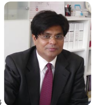
株式会社ビジョンマルチメディアテクノロジー クマール社長

弊社はチームワークとパートナーシップを確立し、皆様に革新的でより良いデザインの製品を経済的な価格で提供していきたいと思っております。