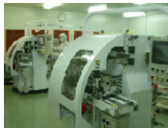
スリット加工装置

PET・ポリイミドなどのフィルム系材料、銅・アルミ・ニッケル・チタン・アモルファス合金などの非鉄金属、及びそれら素材の複合材料まで（粘着製品含む）材質を問わず高精度スリット加工が可能。