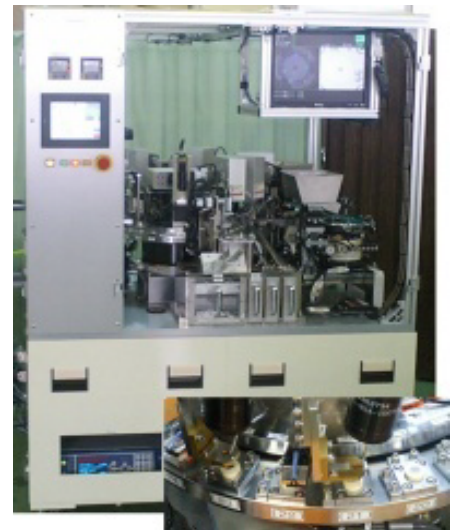
丸型安全弁組立機

丸型リチウムイオン電池に使われている丸型安全弁(電池異常から電子機器を守る)を高速かつ高品質で生産する組立機は、市場から高い評価を得て、海外にも輸出している。