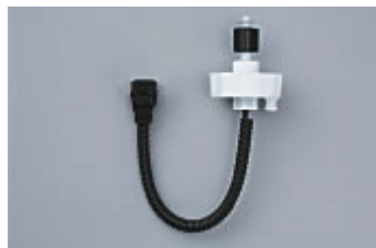
大型エンジン用 水検知センサ