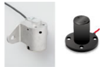
汎用エンジン用 オイルセンサ (縦置型・横置型)