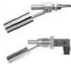
ステンレス製フロート式 レベルスイッチ

その技術力をいかして応用商品であるレベルスイッチの分野へも進出。中でもステンレス製の横型タイプレベルスイッチは国内外から高い評価を得ている。