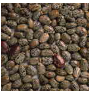
ヒマシ（ヒマの種子）

CO2対策での石油化学からの転換、VOC削減、生分解性向上の観点から、天然油脂であるヒマシ油には大きな可能性が広がっており、最近では、自動車シート用ウレタンフォーム分野で石油系からヒマシ油系への転換が進められ注目されている。ヒマシ油のトップメーカーである同社は、大学との共同開発等により、これらのニーズに対応した高性能製品を開発している。