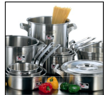
世界初200ボルトIHッキングヒーター対応鍋

国産初の多重層鍋（鉄とステンレス3層鍋）を開発するなど、ステンレス製品作りに高い技術力を有していることから、電力会社の依頼を受け、世界初の200ボルトIHッキングヒーター対応鍋の開発に成功した。