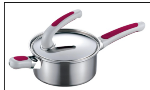
軽量化を図っているIHッキングヒーター対応鍋