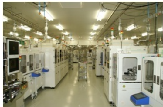
マイクロカメラモジュール生産ライン