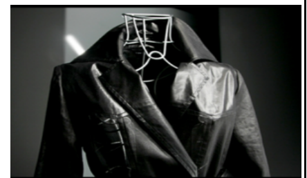
YUKI TAKASE ブランド

地元デザイナーの協力によりライフスタイル全体を提案するオリジナルブランド「YUKI TAKASE」を立ち上げ、差別化素材を開発・製造しているテキスタイルメーカーならではの発想のもと、時代のニーズにあった新鮮でかつ高品位なものづくりを行い、金沢の女性が求める機能性や女性らしさを世界で唯一の形にして金沢独自の装いを提案するなど、地域繊維産業の活性化、イメージアップに貢献している。