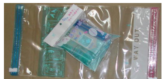
どこでも洗濯できる洗濯パック