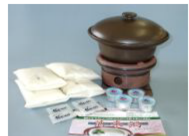
手作り豆腐キット