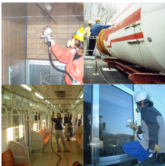
ロケット/地下鉄/ビルの施工事例

同社が開発した光触媒「M-クリーン」は、繊維製品はもちろんのこと、空港・ビル・ホテル・病院・住宅・介護施設・飲食店・スポーツジム・温室・温泉・高速道路・標識・看板・モニュメント・像・冷却塔・噴水・プール・煙突・鉄橋・橋梁・ガス/石油タンク・船舶・鉄道・バス・タクシー・飛行機など、いわば靴下からロケットまで幅広く使用されており、製造は社内一貫生産、販売先は、アメリカ・ヨーロッパ・アジアなど、世界中に広がっている。